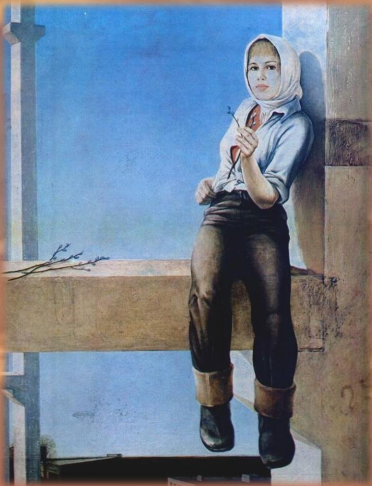
«Новый день» Я. Крыжевский, 1976 г.

Сегодня возрождается традиция студенческих отрядов.